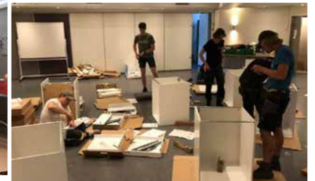
Kjøkkenet ble bestilt og montert av Henning Håkedal fra Agder storkjøkkensenter, Froland.