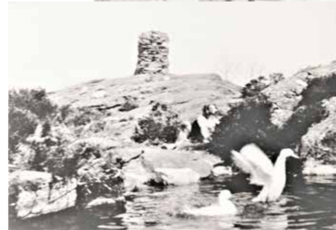
- Kiellands frihetsvarde på toppen av Sumatra