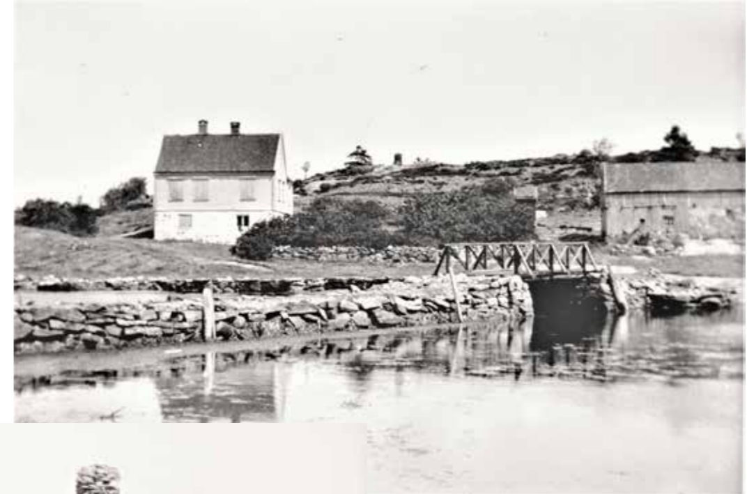
- Huset på Sumatra i 1933. Vi kan skimte frihetsvarden til høyre for huset.