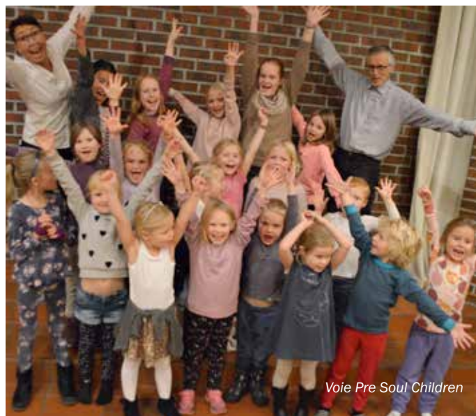
Voie Pre Soul Children