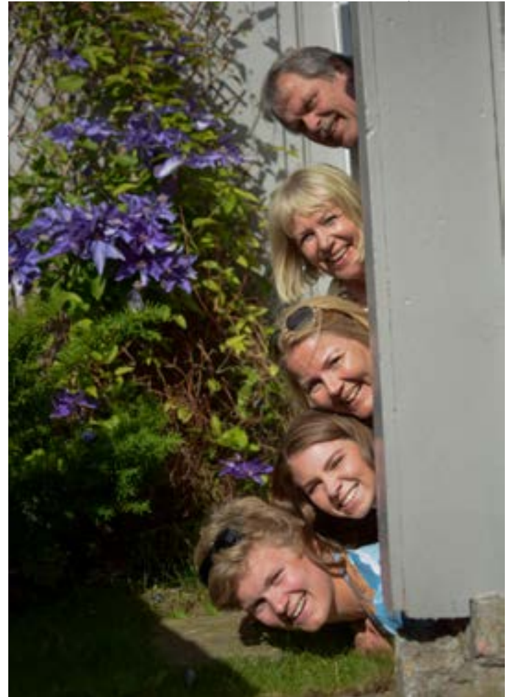
Denne gjengen er blant de som allerede vet at de skal være med på høstens kursrekke i Voie kirke. De skal på Input. Skal du?